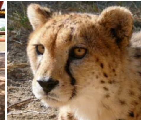
Spektakuläre Tierbeobachtungen im Etosha Nationalpark