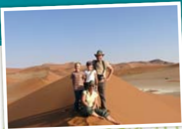
Familie Stoll in den Dünen von Sossusvlei

15 REISETAGE ab € 2.699,- p.P. / ab € 1.899,- pro Kind