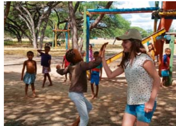
Zu Besuch im Kinderhilfsprojekt Mammadu

Wir legen während unserer Namibia-Familienreise aber nicht nur speziellen Wert auf die großen Wildtiere Afrikas, sondern nehmen uns auch Zeit für die „Little Five“ und suchen mit einem Wüstenprofi zum Beispiel nach der Elefantenspitzmaus und dem Ameisenlöwen. Weitere Highlights der Tour sind der Besuch einer Krokodilfarm und eines Wildkatzenprojekts sowie eine Katamarantour zur Robbenkolonie. Aber nicht nur die Tiere, sondern auch die Menschen des Landes lernen wir kennen, zum Beispiel die Buschmänner der San und die Waisenkinder von Mammadu. Und wir erklimmen die höchsten Dünen der Welt – ein gigantischer Sandkasten für Groß und Klein!